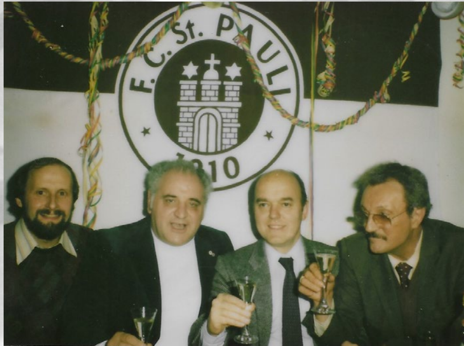
LINKS: SOMMER (STELLY. JUGENDLEITER DAMALS)