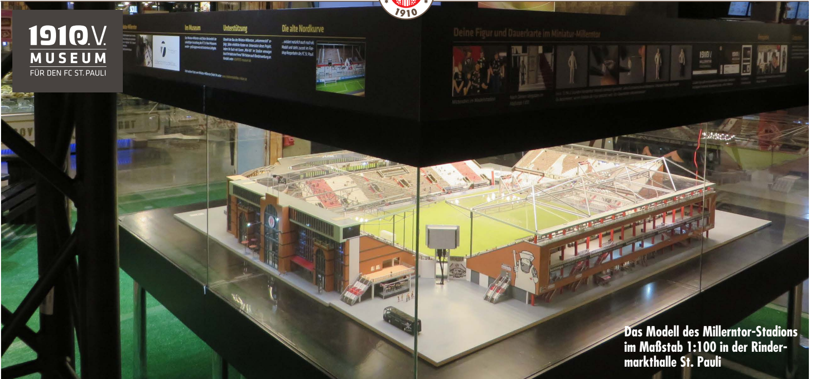
Das Modell des Millerntor-Stadions im Maßstab 1:100 in der Rindermarkthalle St. Pauli